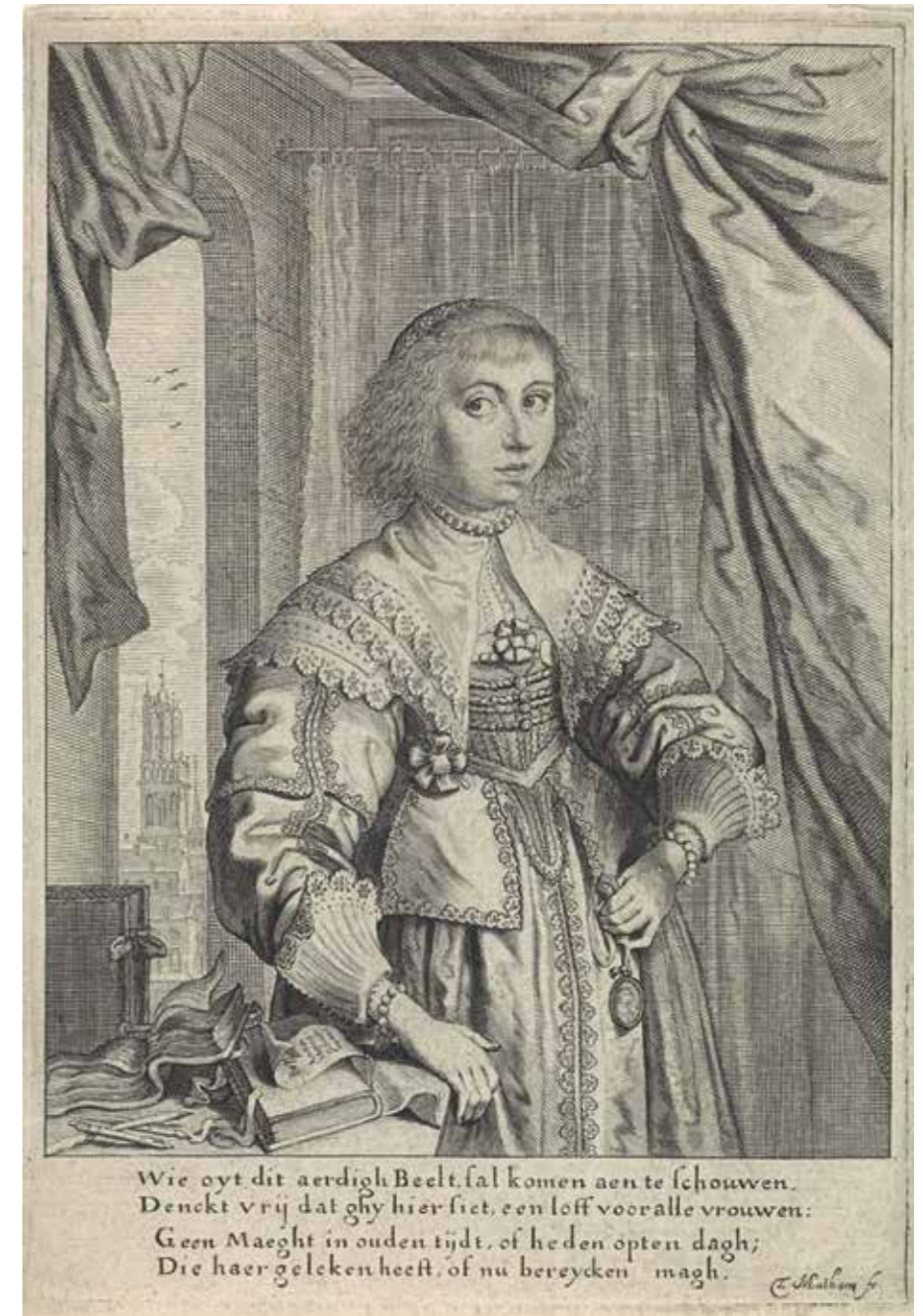
Zelfportret van Anna Maria van Schurman, oorspronkelijk in de Trouwing van Jacob Cats (1637); talloze keren herdrukt. Op de achtergrond de Domtoren.