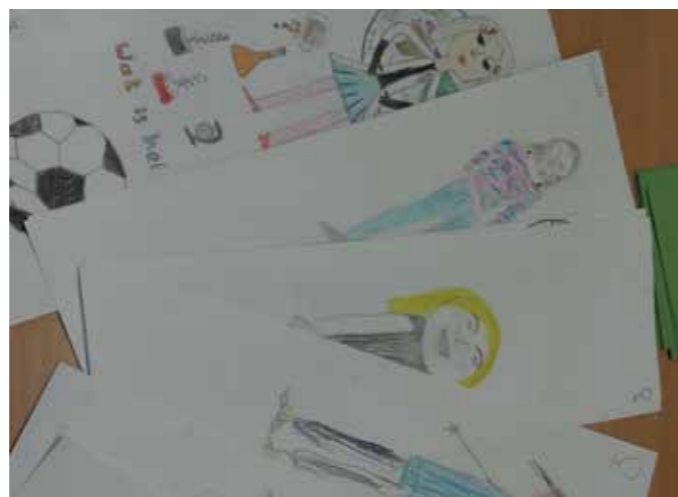
Voorafgaand aan het bezoek tekenen kinderen hun beeld van hoe een professor eruitziet.

Bij de Meet the Professor-quest hoort ook een tekenopdracht, waarbij de kinderen hun beeld van de professor tekenen, voordat