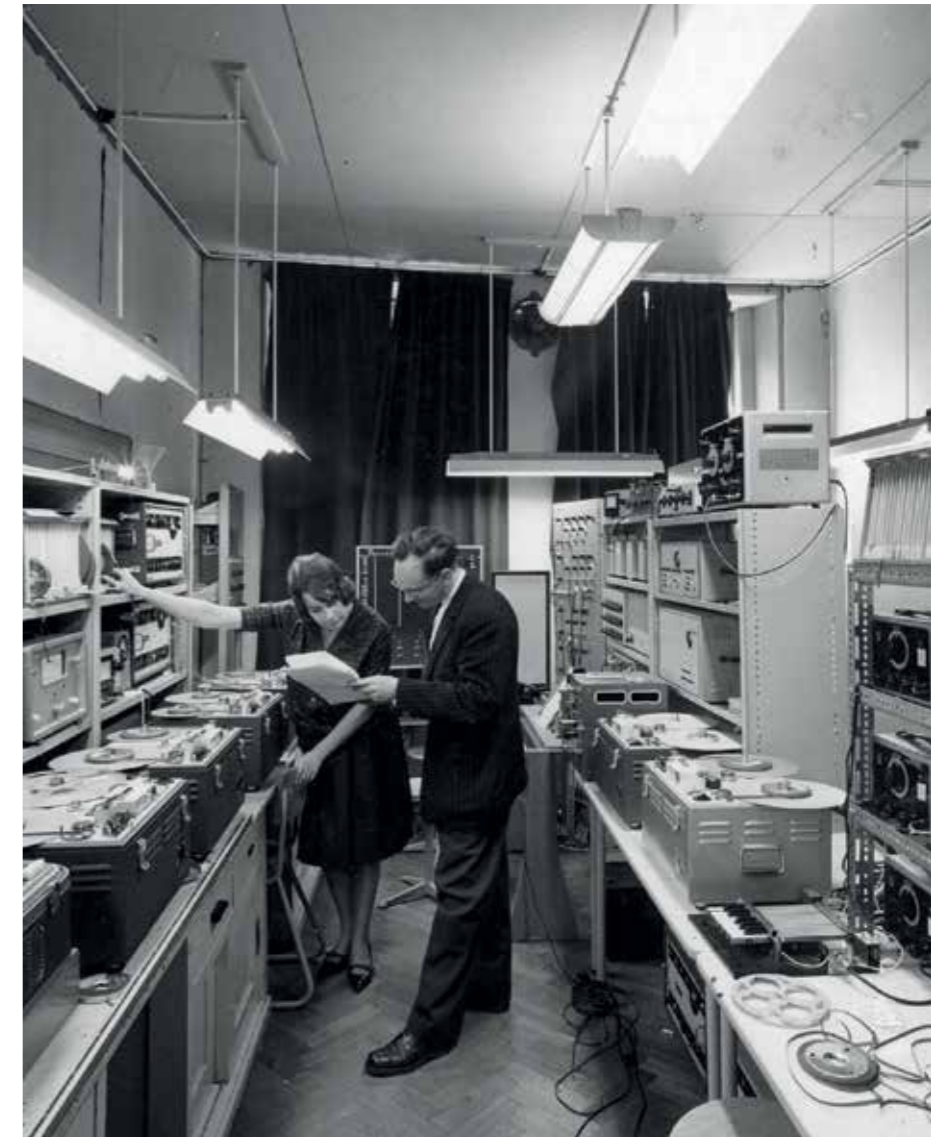
Instituut voor Sonologie van de faculteit Letteren van de Rijksuniversiteit Utrecht